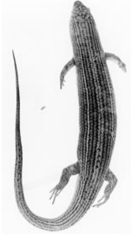
Şekil 2. Kuzey Kıbrıs Mabuya vittata örneklerinde görülen a-tip desene sahip bir bireyde desen varyasyonu. Her bir dorsal pulun her iki tarafında bulunan bariz siyah çizgiler halindeki lekeler ard arda gelerek, baş arkasından kuyruk ucuna kadar uzanan, hatta ön ve arka ekstremiteler üzerinde de görülen uzunlamasına zig-zag çizgiler oluştururlar.

Chalcides ocellatus 'da belirtildiği gibi (30), M. vittata 'da da üreme canlı doğurma şeklinde gözlenmiştir. Bununla birlikte gerçek vivipari veya ovovivipari'ye sahip olup olmadıkları ayrıca araştırılması gereken bir konudur. Mayıs ayı başında yakalanan ve karnı açılarak disekte edilen dişi örneklerde gelişmiş embriyolu yumurtalar tespit edilmiştir. Mayıs sonlarında ortamlarda bol juvenil örneğe rastlanması, bunların Nisan-Mayıs ayı içerisinde yavruladıklarını işaret eder.