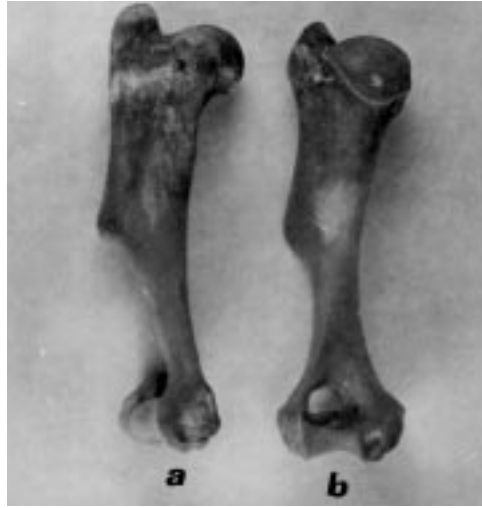
Şekil 2. Humerus'un a) lateral, b) caudal'den görünüşü.