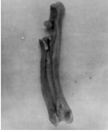
Şekil 3. Antebrachium'un lateral'den görünüşü.

caudale ve distale doğru gelişmiş, proximal yüzünde os triquetrum ile birlikte processus styloideus lateralis'in oturmasına mahsus bir eklem çukuru oluşturmuştur (Şekil 4).