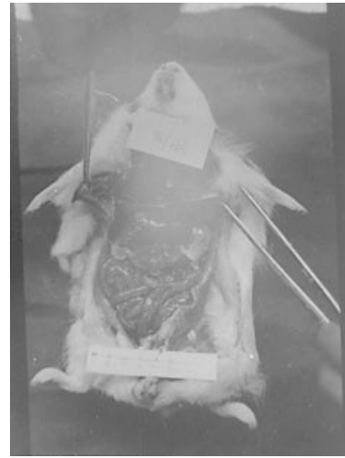
Şekil 1. Karaciğerde büyüme ve pseudomembran oluşumu

oldukları belirlenmiştir. Canlı olanlar eter sülfirik ile ötenazi edildikten sonra ölü olarak getirilenlerle birlikte kobaylara sistemik nekropsi uygulanmıştır. Nekropsi yapılan bütün kobayların karın bölgesinde ortalama 50cc. kadar berrak sıvının toplandığı görülmüştür. Bütün karın organlarının belirgin olarak konjesyone durumda olduğu gözlenmiştir. Karaciğerin büyüdüğü ve hem yüzeyinde, hem de kesit yüzeyinde fokal nekroz odaklarıyla dolu olduğu ve üst yüzeyinde ise ince bir pseudomembran oluştuğu gözlenmiştir (Şekil 1). Aynı şekilde dalağın da büyüdüğü yüzeyinde fokal nekroz odaklarının oluştuğu ve kapsulası üzerinde ise kalın bir pseudomembran tabakasının meydana geldiği tespit edilmiştir. Benzer pseudomembranların peritonun parietal kısmında da şekillendiği görülmüştür. Bağırsakların özellikle sekumun kiremit renginde bir içerikle dolu olduğu gözlenmiştir.