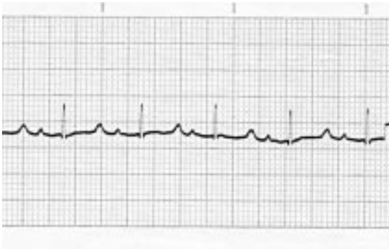
2. Grup (Droperidol-Fentanil)