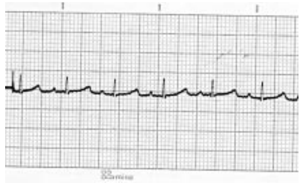
5. Grup (Sodyum pentotal)