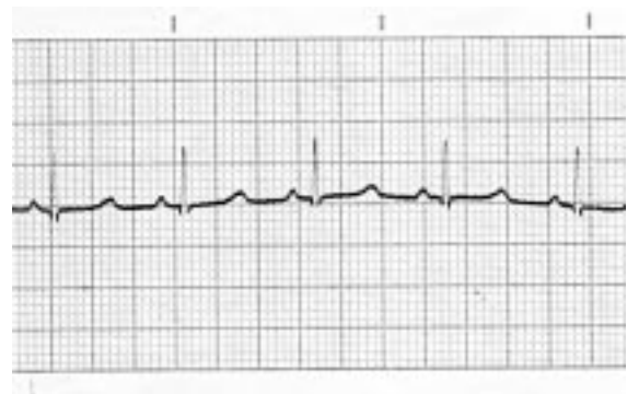
3. Grup (Ketamin-Ksilazin)