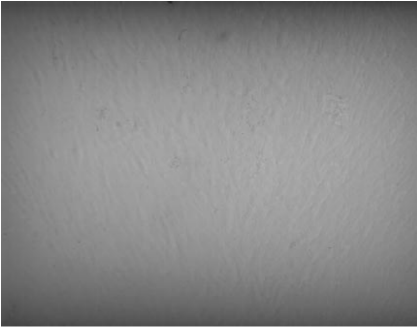
Şekil 3. Virus inokule edilmemiş CEF hücre kontrolü (Olympus, 20X).

kültürü, AGP ve elektron mikroskopi (EM) gibi tekniklerle Türkiye IBDV 'leri teşhis edilmiş (24, 37), serolojik olarak sahada AGP, nicel AGP (QAGP) ve enzyme-linked immunosorbent assay (ELISA) testlerinden yararlanılmıştır (40). Teşhis Laboratuvarlarında Gumboro hastalığının hızlı ve doğru teşhisi amacıyla immunoperoksidaz (IP) ve immunofloresan (IF) gibi teknikler yerleştirilmeye çalışılmaktadır (41).