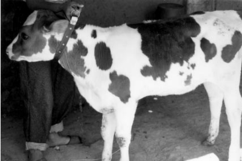
Şekil 3. Hastanın tedaviden sonraki genel görünümü.

hücrel bir kabuk formasyonuna rastlandı. Dermis'te ise papillardan bazılarında konjesyon mevcuttu.