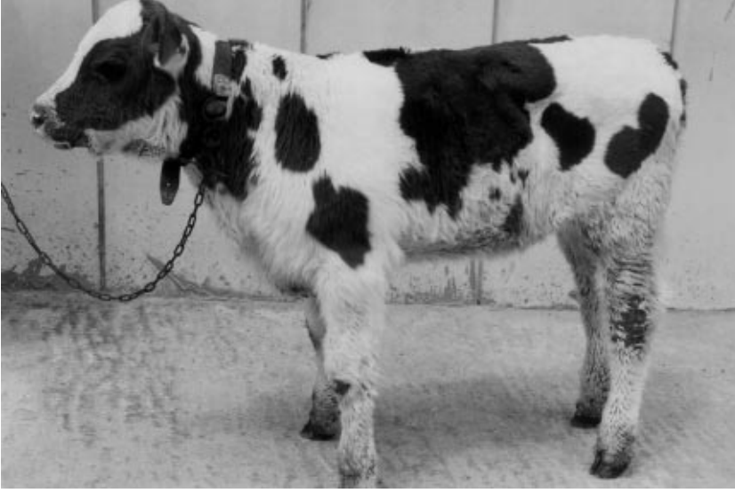
Şekil 1. Hastanın tedaviden önceki genel görünümü.