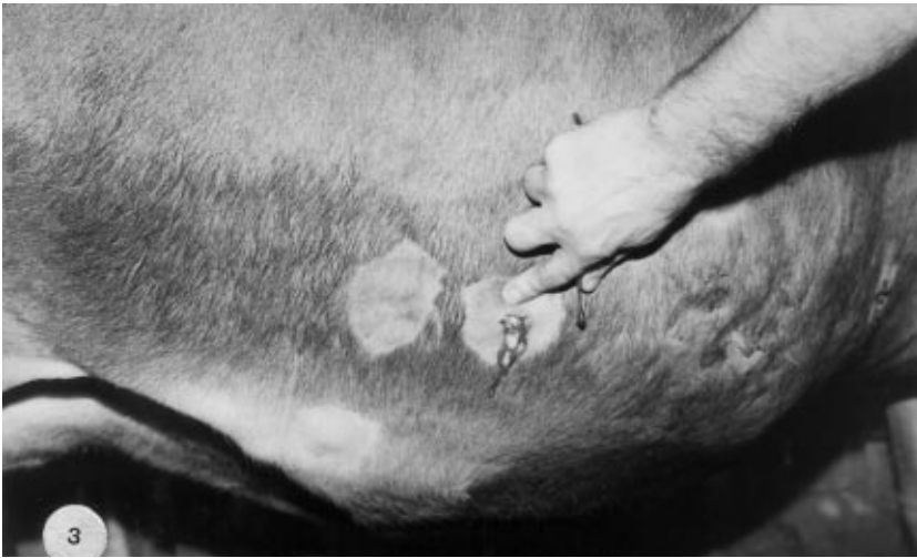
Şekil 3. Nodülden Çıkan Kanlı, Peynir Kıvamındaki Eksudatın Görünüşü

Parafilariosisli hayvanların 20'sinde vücudun yan taraflarında özellikle karın altına yakın yerlerde, omuz ve ayaklarda 20-45 mm büyüklüğünde, 1-6 arasında değişen sayıda nodüllere rastlanmıştır (Şekil 2). Nodüllerden özellikle küçük olanlarının ödematoz, büyük olanlarının ise iğnin hemorajik ve peynir kıvamında bir eksudatla dolu olduğu görülmüştür (Şekil 3). Enfekte hayvanların 16'sında ise sayıları 1-2 arasında değişen kanayan nodüller tespit edilmiştir. Kanayan nodüllerde ödemin kaybolduğu dikkati çekmiştir (Şekil 4, 5). Ayrıca, 21 siğirda özellikle yere temas eden kısımlarda enfekte olmuş geniş yaralara rastlanmıştır (Şekil 5).