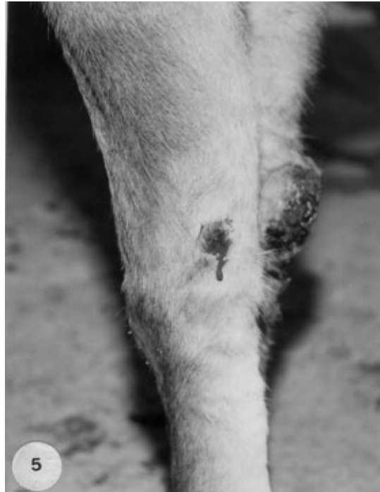
Şekil 5. Ön Sol Ayakta Kanayan Nodülün Görünüşü