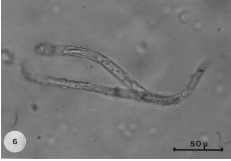
Şekil 6. Parafilaria bovicola Mikrofilerlerinin Görünüşü