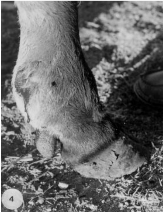
Şekil 4. Ön Sağ Ayakta Kanayan Nodülün Görünüşü