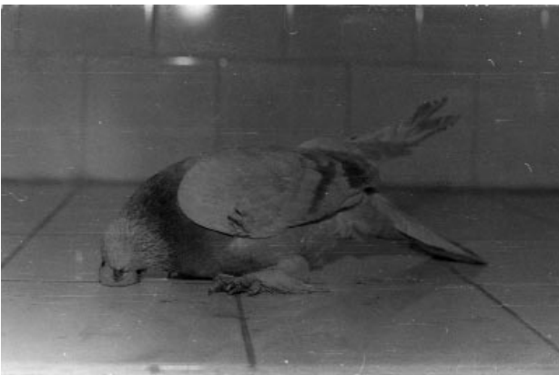
Şekil 1. Tedavi Öncesi Güvercinin Görünümü

Sonuç olarak; güvercinlerde ensefalomalasi olgularının vitamin E uygulamaları ile tedavi edilebilirliği konusunda daha detaylı çalışmaların yapılması gerektiği kanısındayız.