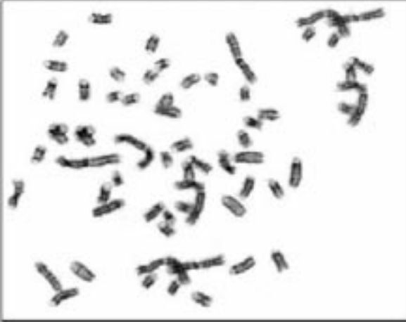
Şekil 1. Konya Yaban Koyununa Ait Bir Metafaz (2n=54).

Çalışma, Selçuk Üniversitesi Veteriner Fakültesi kliniklerine Coenurus cerebralis şüphesiyle getirilen bir adet dişi yaban koyun üzerinde gerçekleştirildi. Koyunda morfolojik olarak herhangi bir anomali yoktu. Koyundan alınan kandan üretilen kromozom preparatları Seabright (9)'ın bildirdiği metotla G-bantlama ile boyandılar. Uygun olan metafaz plakları Macktype 5.5 programıyla Macintosh PSI bilgisayara aktarıldı. Kromozomlar bilgisayarda Ansari ve ark. (7)'nin koyunlar için bildirdiği şekle göre Windows programı altında çalışan Paint programında numaralandırıldı ve bir karyotip elde edildi. Yaban koyunundan elde edilen bir metafaz sahası ve bu metafazdan elde edilen karyotip Şekil 1 ve 2'de gösterilmektedir.