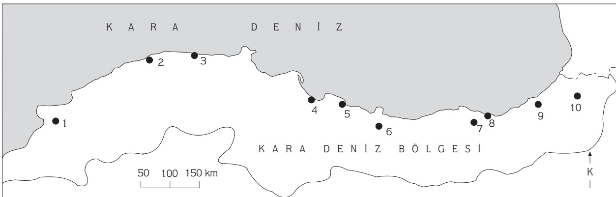
Şekil 1. İncelenen R. ridibunda populasyonlarının toplandığı mahaller. (1.Düzce, 2.Cide-Kastamonu, 3.Abana-Kastamonu, 4.Kurtunçay-Samsun, 5.Terme-Samsun, 6.Ulubey-Ordu, 7.Uzungöl-Trabzon, 8.Araklı-Trabzon, 9.Çamlıhemşin-Rize, 10.Artvin).