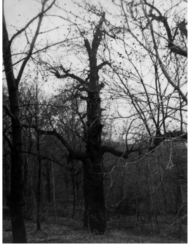
Şekil 4. Meşcerede saptanan en yaşlı ağaç (Yaş=350 yıl)