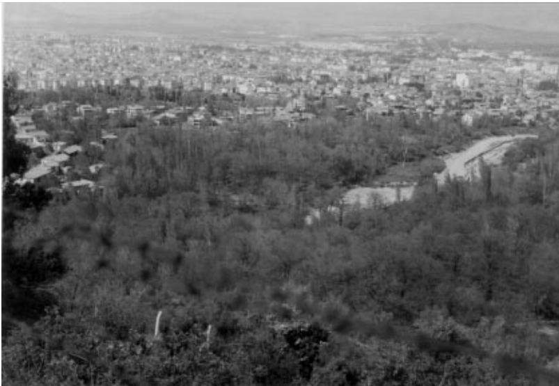
Şekil 2. Anıt meşçereden bir görünüş

Isparta'da, Dere ve Yenice mahallerindeki araştırmamıza konu bu doğal kestane meşçeresi ile bugün mesire yeri olarak kullanılan "Ayazmana Kestaneliği" dışında, Sütçüler'e bağlı Kasımlar kasabasında da, Anadolu kestanesini de bulunduran doğal meşçereler mevcuttur. Sütçüler Orman İşletme Müdürlüğü Tota Orman İşletme Şefliği Orman Amenajman Planına göre 81 numaralı bölme içinde kalan, 28 hektarlık bu sahada, ana meşçereyi Anadolu Karaçamı ( Pinus nigra Arnold subsp. pallasiana Lamb. Holmboe.) oluşturmaktadır. Kestane ve büyük yapraklı ıhlamur ( Tilia platyphyllos Scop.) ağaçları ise, meşçere içinde serpili (karışıma katılma oranı \geq % 10) haldedir. Kestaneler 880 - 1150 m, ıhlamurlar 1000 -