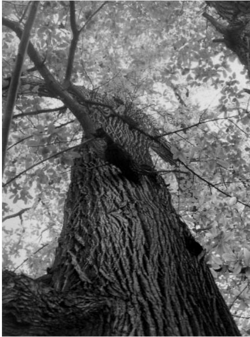
Şekil 5. Göller Yöresi'ndeki bilinen en boylu kestane ağacı (Boy=33 m)

Yenice Mahalleri içinde kalan bu doğal anıtsal meşcere, Türkiye'nin en uzun boylu (33,0 m), Göller Yöresi'nin en yaşlı (350 yıl) ve en kalın çaplı (207 cm) kestane ağaçlarını bünyesinde bulundurmaktadır. Ancak, Türkiye'nin en yaşlı (544) ve kalın çaplı (312 cm) kestanesi Akseki-İbradi'dadır.