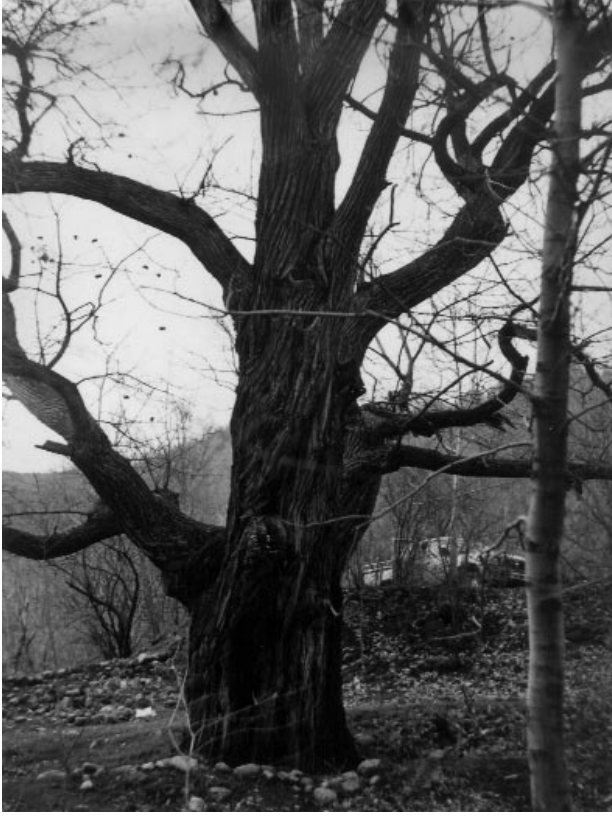
Şekil 3. Meşceredeki en görkemli anıt ağaç (Yaş=230, Boy=20 m, Çap=207 cm)