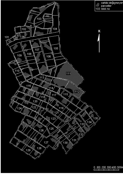
Şekil 1. Model A'da eski yerinde sahipleri adına verilen parseller.