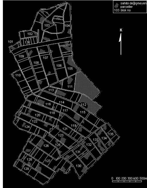
Şekil 2. Model B'de eski yerinde sahipleri adına verilen parseller.

değişimine uğramıştır. Model B'de ise bu değerler sırasıyla %18,31 ve %81,69 olarak gerçekleşmiştir. Anılan değerler proje alanındaki işletme gruplarına göre derlenerek Tablo 2'de verilmiştir.