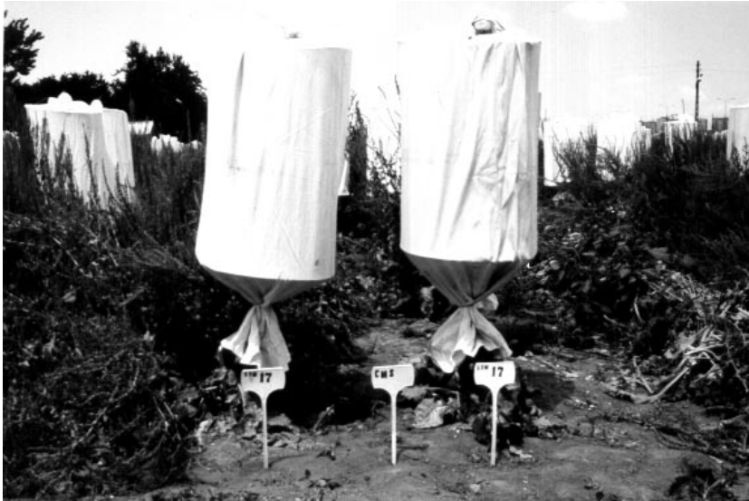
Şekil 2. O - Tip bitkilerin test kafesleri.

ayının ilk haftasında Etimesgut (Ankara) İstasyonunda tarlaya dikilmişlerdir. Tek yılda tohuma kalkan pancarlar Haziran ayının ortasında çiçeklenmeye başlamıştır. O-tip testi için, tohum dalları iyi gelişmiş, bol polenli, sık ve iri tohumlu, yüksek oranda monogerm (> %95) olan fertil bitkiler, tester olarak ise yeşilimsi - beyaz anterli, polensiz, iyi gelişmiş erkek kısır bitkiler seçilmiştir.