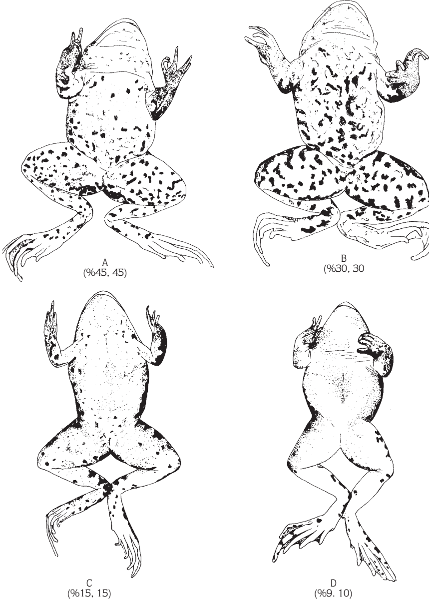
Tablo 3. Karadeniz R. ridibunda populasyonlarını literatur bilgisiyle karşılaştırması (Schneider ve ark. (13)*; Arıkan ve ark. (5)**), [Kısaltmalar Tablo 1'de verilmiştir].